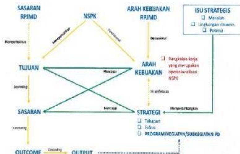
Gambar 3.1 Alur perencanaan

Dalam rangka mewujudkan visi dan misi pembangunan Kabupaten Magetan tahun 2025–2029, serta sebagai tindak lanjut dari Rencana Pembangunan Jangka Menengah Daerah (RPJMD) Kabupaten Magetan, penyusunan Rencana Strategis (Renstra) Dinas Pendidikan, Kepemudaan dan Olahraga menjadi langkah penting untuk memastikan bahwa semua program dan kegiatan yang dilaksanakan dapat menjawab tantangan yang ada dan memberikan manfaat maksimal bagi masyarakat. Karena mengacu pada RPJMD Kabupaten Magetan, maka secara otomatis Renstra Dinas Pendidikan, Kepemudaan dan Olahraga juga mengacu pada dokumen perencanaan di atasnya yaitu RPJMD Kabupaten Magetan. Kedudukan dan keterkaitan antar dokumen perencanaan dalam sistem perencanaan pembangunan dan sistem keuangan dapat dilihat dalam bagan sebagai berikut: